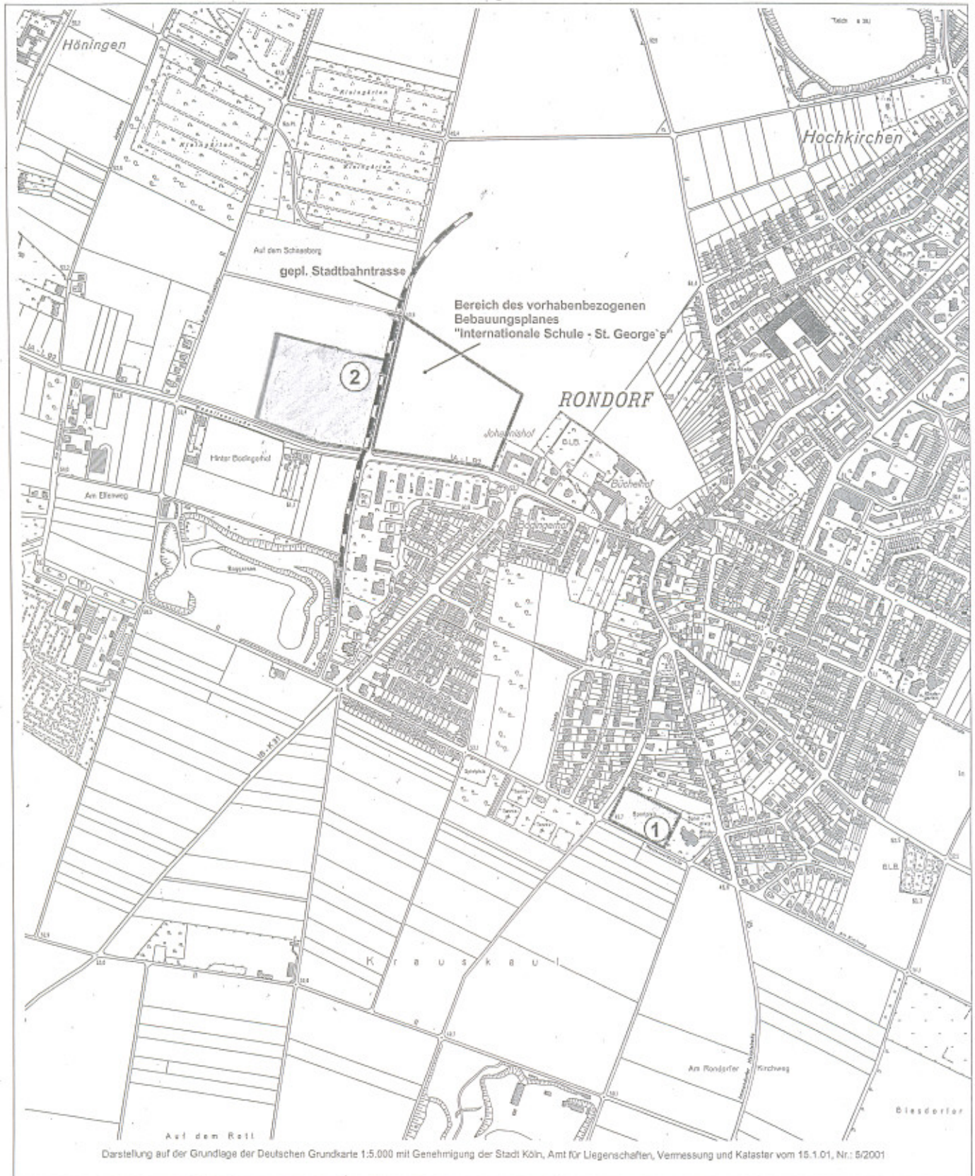
Darstellung auf der Grundlage der Deutschen Grundkarte 1:5.000 mit Genehmigung der Stadt Köln, Amt für Liegenschaften, Vermessung und Kataster vom 15.1.01, Nr.: 5/2001