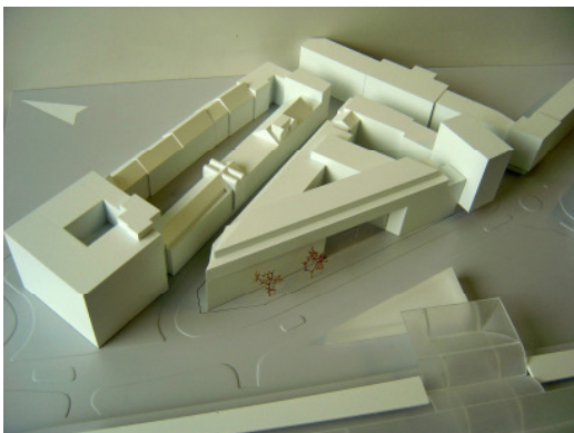
Ankauf Gatermann + Schossig, Köln