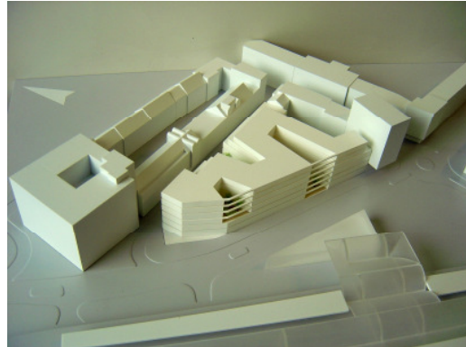
2. Preis HPP- Hentrich Petschnigg & Partner, Düsseldorf