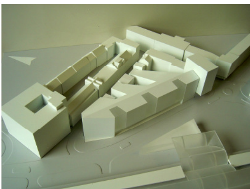
Wulf & Partner, Stuttgart