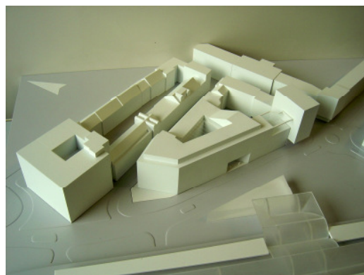
JSWD Architekten, Köln