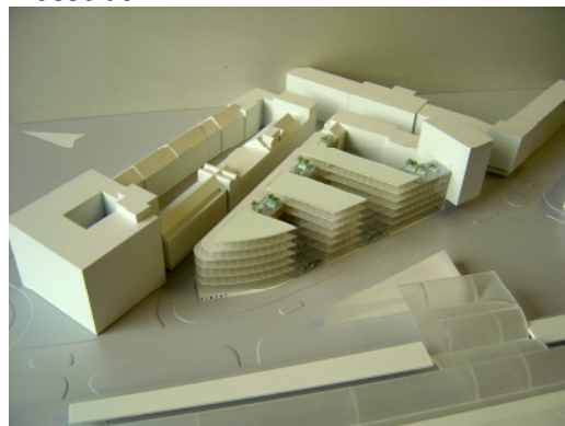
4. Rang StructureLab Architekten, Düsseldorf