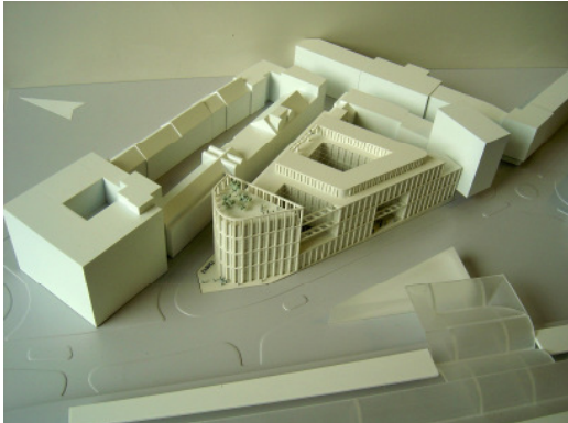
1. Preis MSM, Meyer Schmitz- Morkramer, Köln