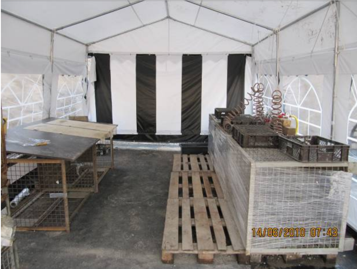
Erstversorgungsstation für die Phase der Bohrfahlerstellung