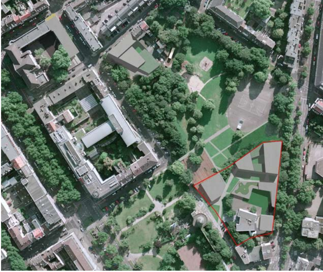
Variante "Anbau an die Jugendeinrichtung" von der Arge feld72Plansinn ohne Erhalt der Platane und Erhalt Wallnuss