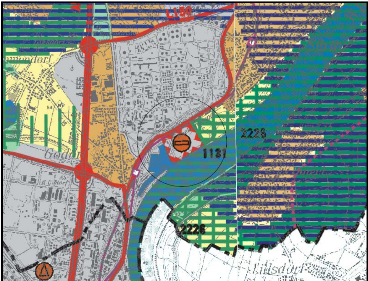
Ausschnitt Regionalplan Regierungsbezirk Köln – Ausschnitt Köln-Godorf mit Signet GIB, Zweckbestimmung "Standort des Kombinierten Güterverkehrs"

Der Änderungsbereich ist im Regionalplan für den Regierungsbezirk Köln, Teilabschnitte L 5106 Köln und L 5108 Köln-Mülheim, als "Bereich für gewerbliche und industrielle Nutzung (GIB)" dargestellt. Zusätzlich ist für die Vorhabensfläche per Signet dokumentiert, dass es sich um ein "GIB für zweckgebundene Nutzungen" und um einen "Standort des Kombinierten Güterverkehrs" handelt (siehe Anlagen 4 und 5).