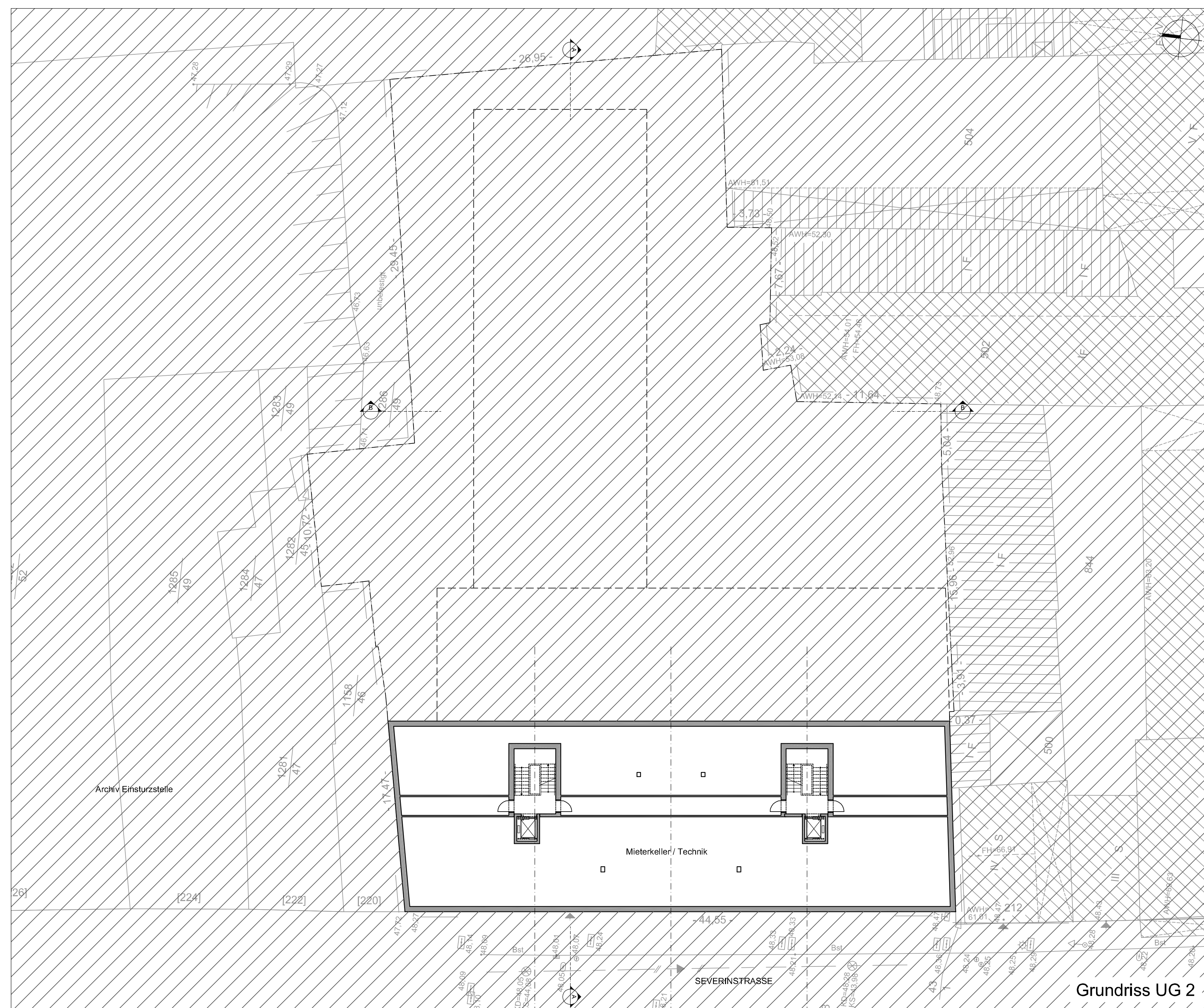
Grundriss UG 2