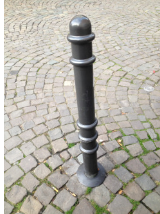
Poller Modell Köln, anthrazit