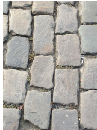
Fahrbahn Casinostraße Grauwackegroßpflaster in Segmentbögen