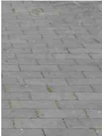
Laubbereiche / Randzone der drei Plätze Grauwackeplatten 30/15/8 cm

Hermann-Joseph-Platz, Augustiner- und Elogiusplatz: