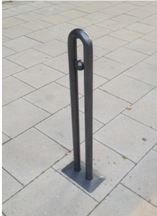
Fahrradständer Haarnadel, Modell Gotik, anthrazit