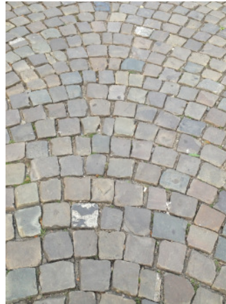
Kernzone der drei Plätze Grauwackekleinpflaster 8/8/8 cm in Segmentbögen