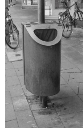
Mülleimer Modell Colonia in Edelstahl, einfach