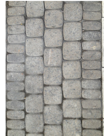
Betonsteinplatten 30/15/8 mit Natursteinvorsatz (oberflächengeflammt Granit) in Kombination mit Betonsteinpflaster 8/8/8, anthrazit, Verlegemuster analog nördlichem Bereich der Hohe Straße