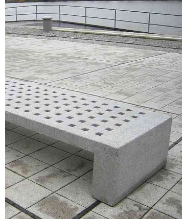
Hockerbank Betonhockerbank durchbrochen Modell Mayo