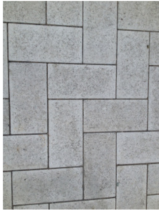
Laufbereiche / Randzone Betonsteinplatten 30/15/8 cm, Läuferverband (Foto zeigt L.Verband)