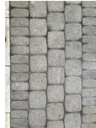
Betonsteinplatten 30/15/8 grau in Kombination mit Betonsteinpflaster 8/8/8, anthrazit, Verlegemuster analog nördlichem Bereich der Hohe Straße