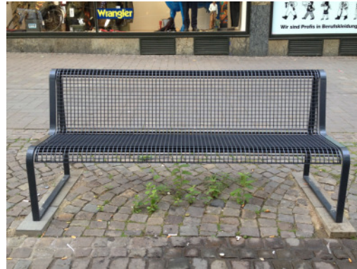
Standardgitterbank Modellreihe Köln