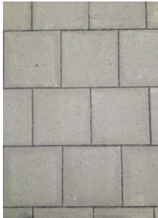
Gehweg und Verkehrsinseln Betonplatte 30/30/8 grau