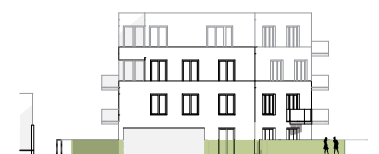
Ansicht Kopfseite Hofgebäude von Südosten