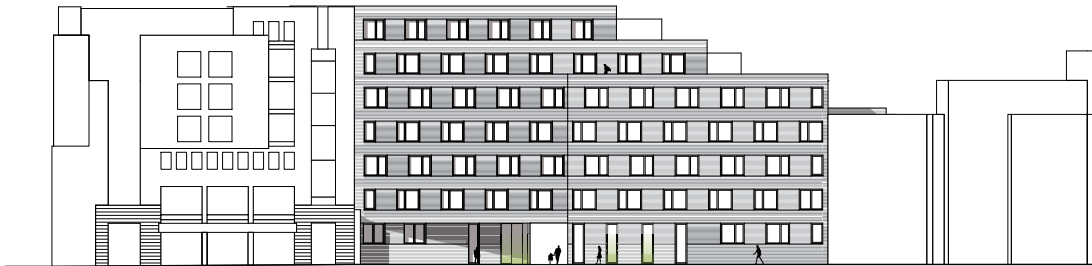
Ansicht Universitätsstraße Vorderhaus