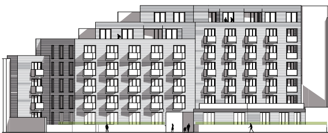
Ansicht Hofseite Vorderhaus