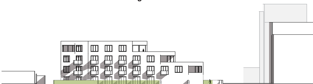
Ansicht Längsseite Hofgebäude von Südwesten