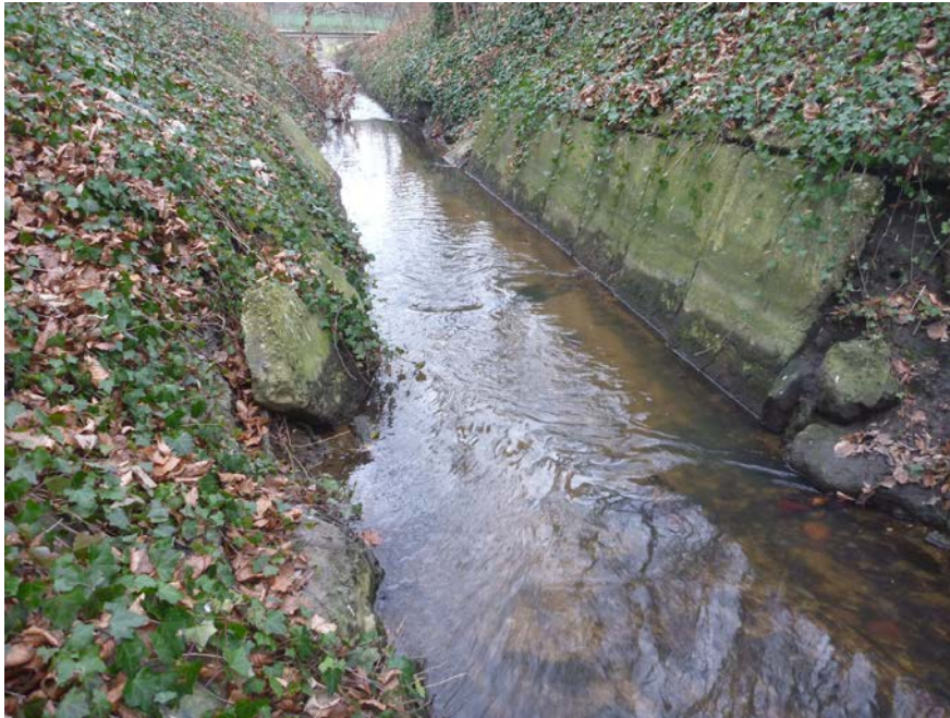
Foto Ist-Zustand, gegen die Fließrichtung