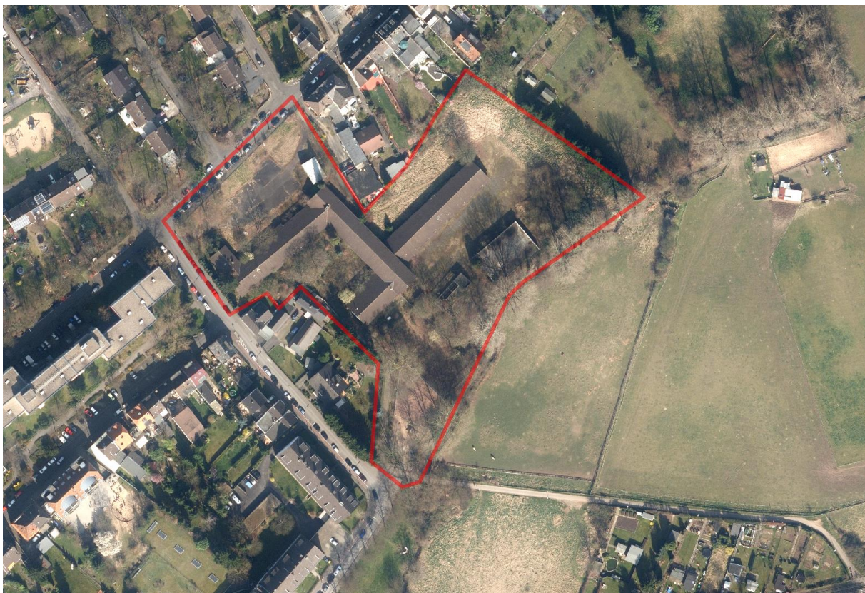
Abbildung 2: Luftbild 2014, ohne Maßstab

Die Umgebung des Plangebietes ist geprägt durch überwiegenden Ein- und Zweifamilienhausbau; ergänzt wird er durch eine Alteneinrichtung und einen Kindergarten. Südöstlich grenzt das Schulareal an den Kemperbach und seine Auewiesen an. Im südlichen Zipfel liegt ein kleiner Bolz- und Spielplatz. Der zentrale Versorgungsbereich an der Dellbrücker Hauptstraße (im Einzelhandelskonzept der Stadt Köln als Stadtteilzentrum eingestuft) ist fußläufig erreichbar.