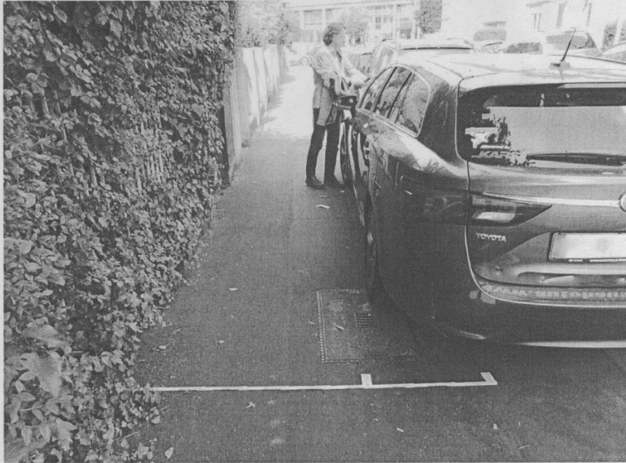
Leichtensternstrasse Köln-Sülz (erste Markierung von li. 120cm, zweite Markierung 180 cm )