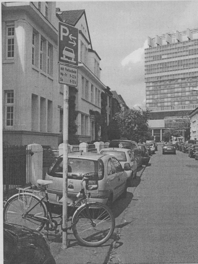
Leichtensternstrasse Köln Sülz