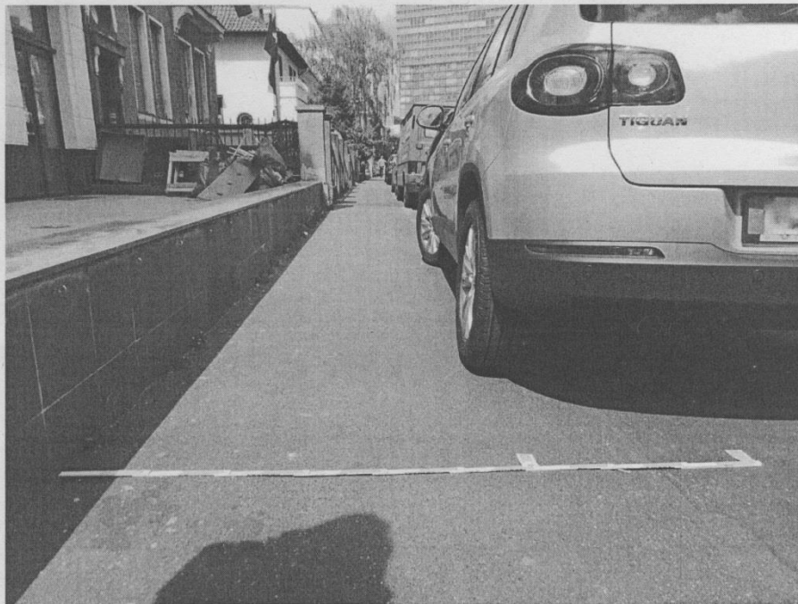
Leichtensternstrasse Köln-Sülz (erste Markierung von li. 120cm, zweite Markierung 180 cm )