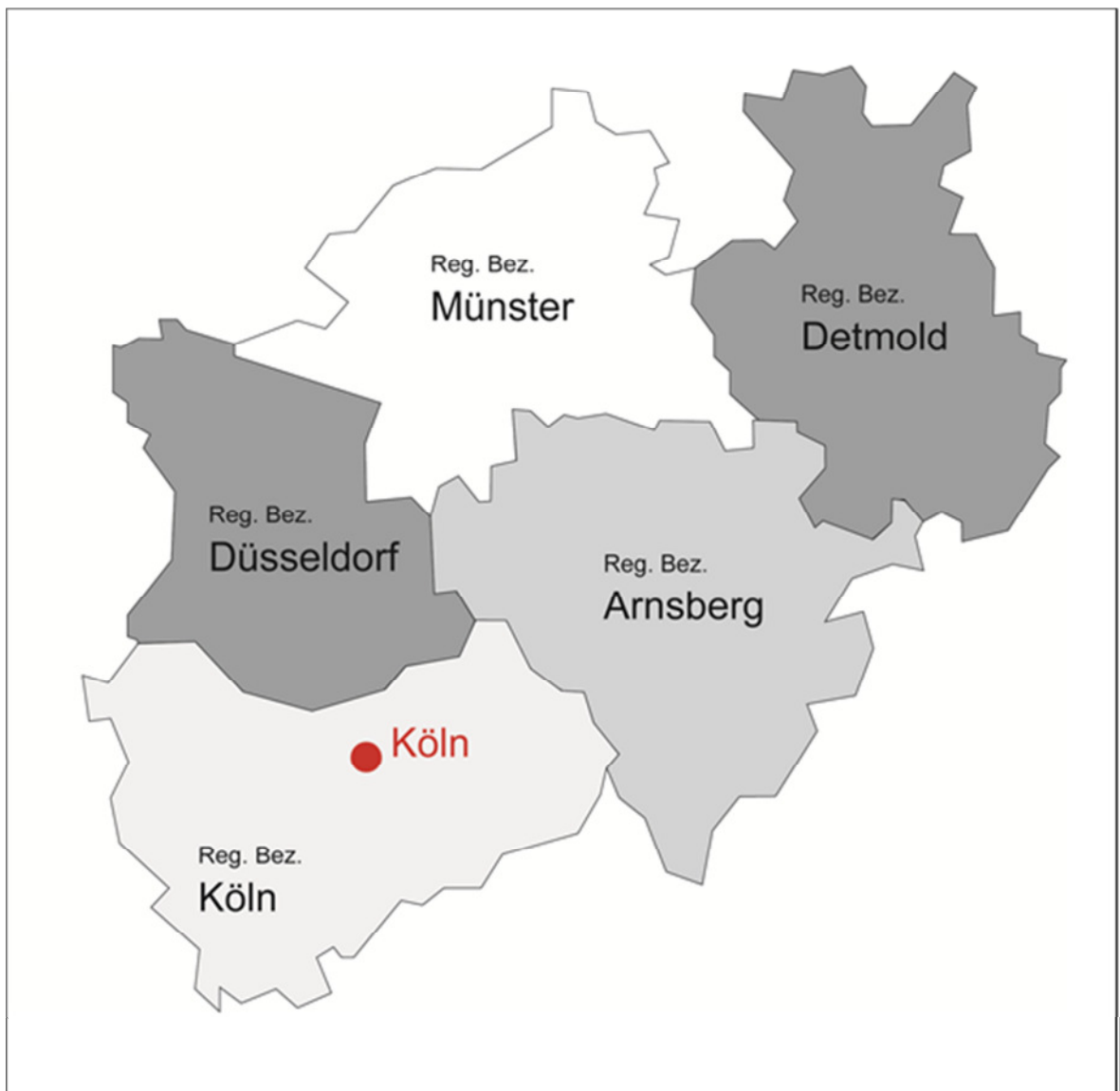
Abbildung 1: Die Lage von Köln in Nordrhein-Westfalen

Die kreisfreie Stadt Köln liegt süd-westlich in Nordrhein-Westfalen im Regierungsbezirk Köln (siehe Abbildung 1). Mit aktuell 1.020.303 Einwohnern ist Köln die größte Stadt des Bundeslandes sowie hinter Berlin, Hamburg und München die viertgrößte Stadt Deutschlands. Das Stadtgebiet verfügt über eine Fläche von 405,2 km 2 (28 km in nord-südlicher und 27 km in west-östlicher Richtung); die durchschnittliche Einwohnerdichte beträgt rund 2.500 Einwohner pro Quadratkilometer.