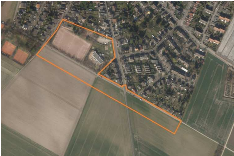
Abbildung 1: Luftbild des Plangebietes einschließlich Plangebietsgrenze

Das Plangebiet wird im Westen durch die Pastoratsstraße und im Norden durch den südlichen Abschluss der vorhandenen Wohnbebauung begrenzt. Seine südliche Grenze verläuft im Abstand von etwa 40 m südlich des Straßenzuges Westerwaldstraße/Am Kirchweg bis zum östlichen Ortsrand. An diesem sowie angrenzend an die Rondorfer Hauptstraße befinden sich seine östlichen Außengrenzen (vergleiche Abbildung 1).