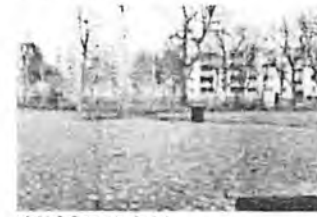
zufällige Freifläche vor dem Sportfeld