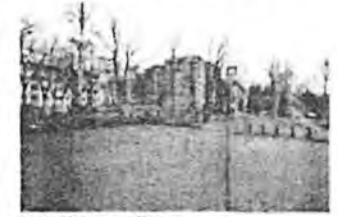
Sportfeld / Blickrichtung nach Süden