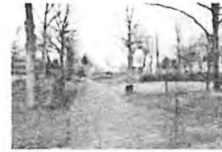
Blick nach Norden auf das Gebäude / Basketball-Liefer Straße

gezeichnet auf Grundlage der aktuellen Flurkarte der Stadt Köln: mit Genehmigung des Amtes für Liegenschaften, Vermessung und Kataster Katasterservice 232-4 der Stadt Köln, 15.02.16 (Antrag-Nr. KB 850/16)