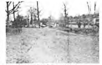
Blick nach Südwesten / zufällige Freifläche vor dem Sportfeld