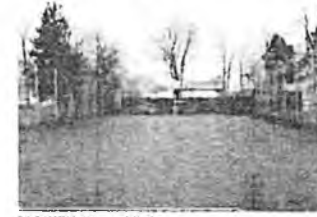
Sportfeld / Blickrichtung nach Norden