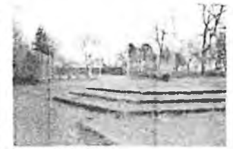
Blick nach Norden auf das Sportfeld