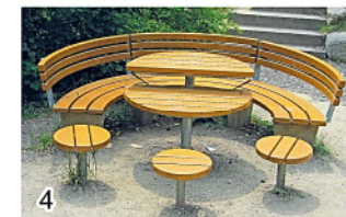
Alles Sitzgruppen und Bänke werden aus Stahl hergestellt!