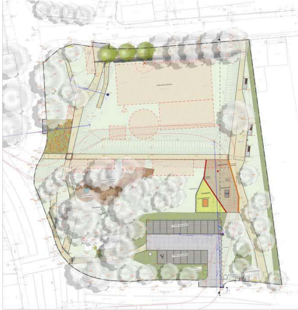
Berücksichtigung des jährlich stattfindenden Schützenfestes auf dem Eiler Schützenplan -Aufstellplan