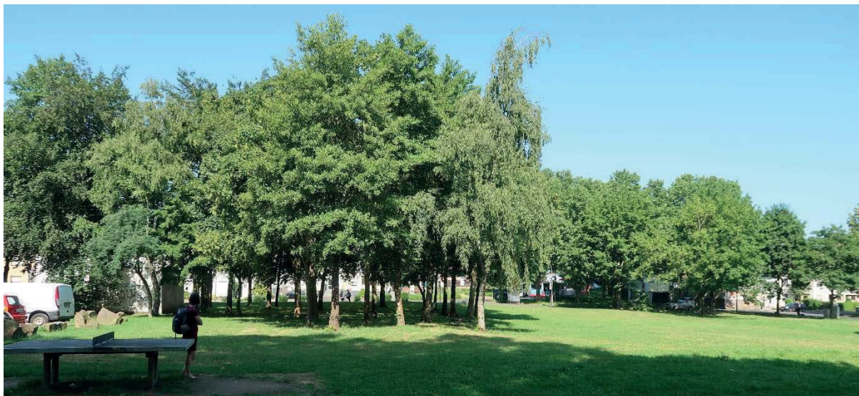
Schützenplatz mit bestehender Tischtennisplatte, Blickrichtung von Osten nach Westen

Umbau von zwei öffentlichen Platzflächen in Porz-Eil zu multifunktionalen Freiräumen mit Retentionsfunktion