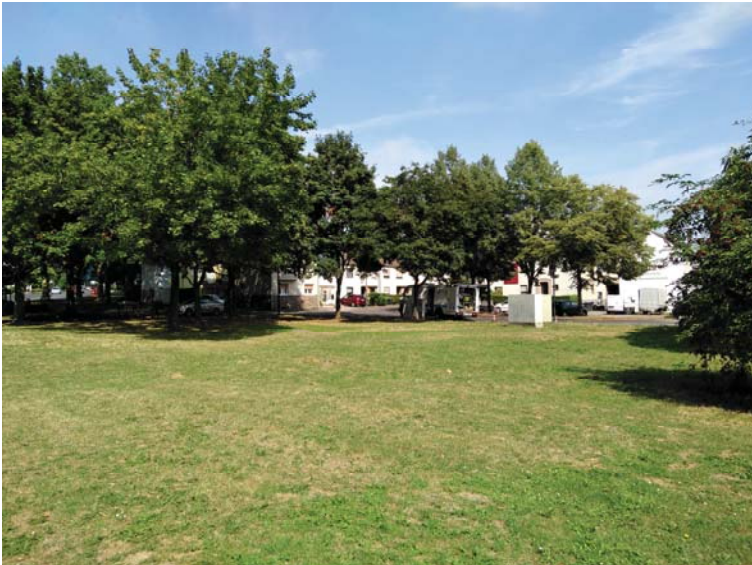
Blick über den Schützenplatz