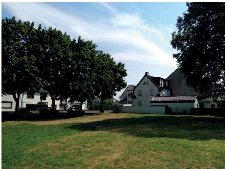
Freifläche Schützenplatz mit Blickrichtung auf geplante Retentionsfläche nach Norden zur Jägerstraße