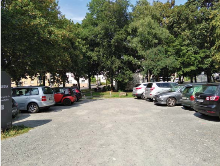
Unbefestigte Stellplatzanlage südlich gelegen auf dem Schützenplatz