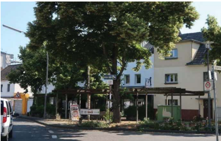
Blick von der Frankfurter Straße aus südlicher Richtung auf den Platz an der Leidenhausener Straße