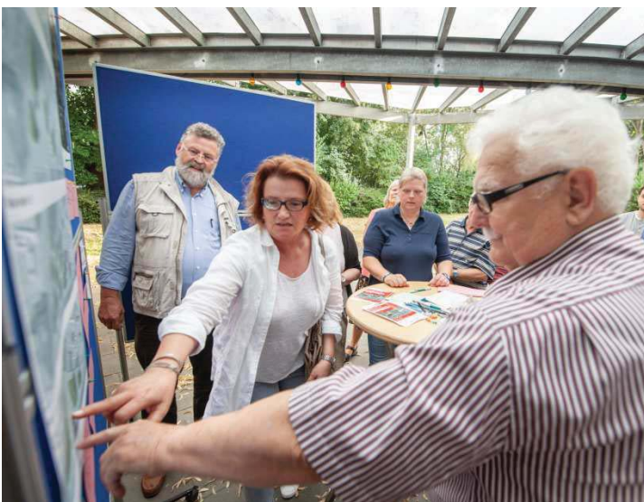
Berücksichtigung der Wünsche der potentiellen Nutzer bei der Öffentlichkeitsbeteiligung