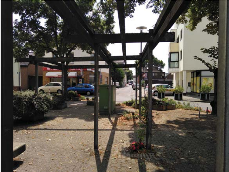
Bestandssituation: Pergola und undefinierte Gestaltung des Platzes an der Leidenhausener Straße