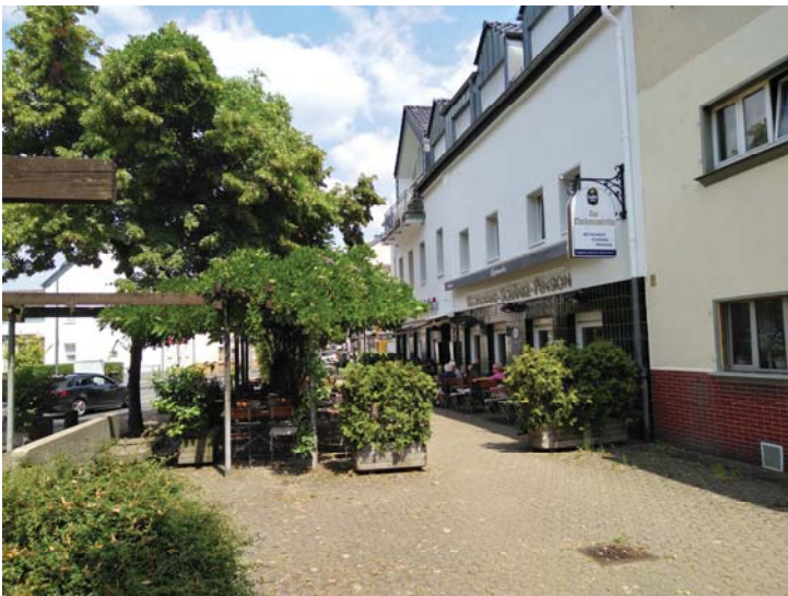
Platz an der Leidenhausener Straße, Blick auf die Gastronomie „Zur Lindenwirtin“ mit Außenbereich