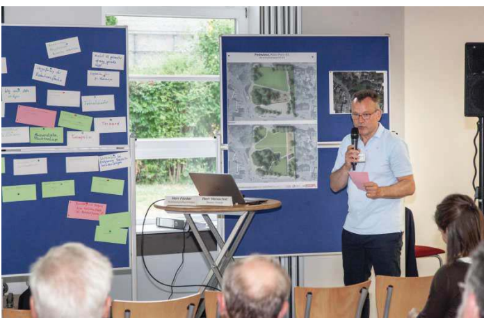
Vorstellen der verschiedenen Entwurfsvarianten bei der Bürgerbeteiligung