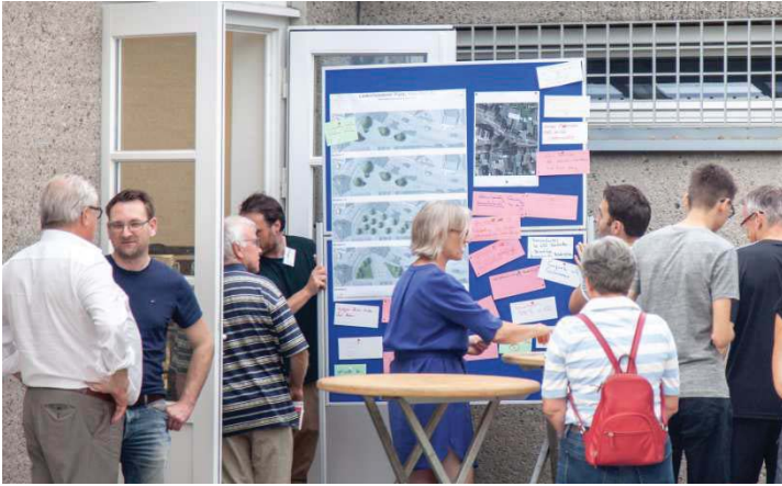
Bürgerbeteiligung – Aufteilung in Kleingruppen