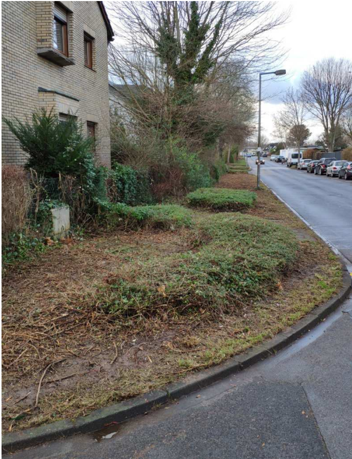
Süd-Ansicht "Abschnitt 1" Richtung Longerich