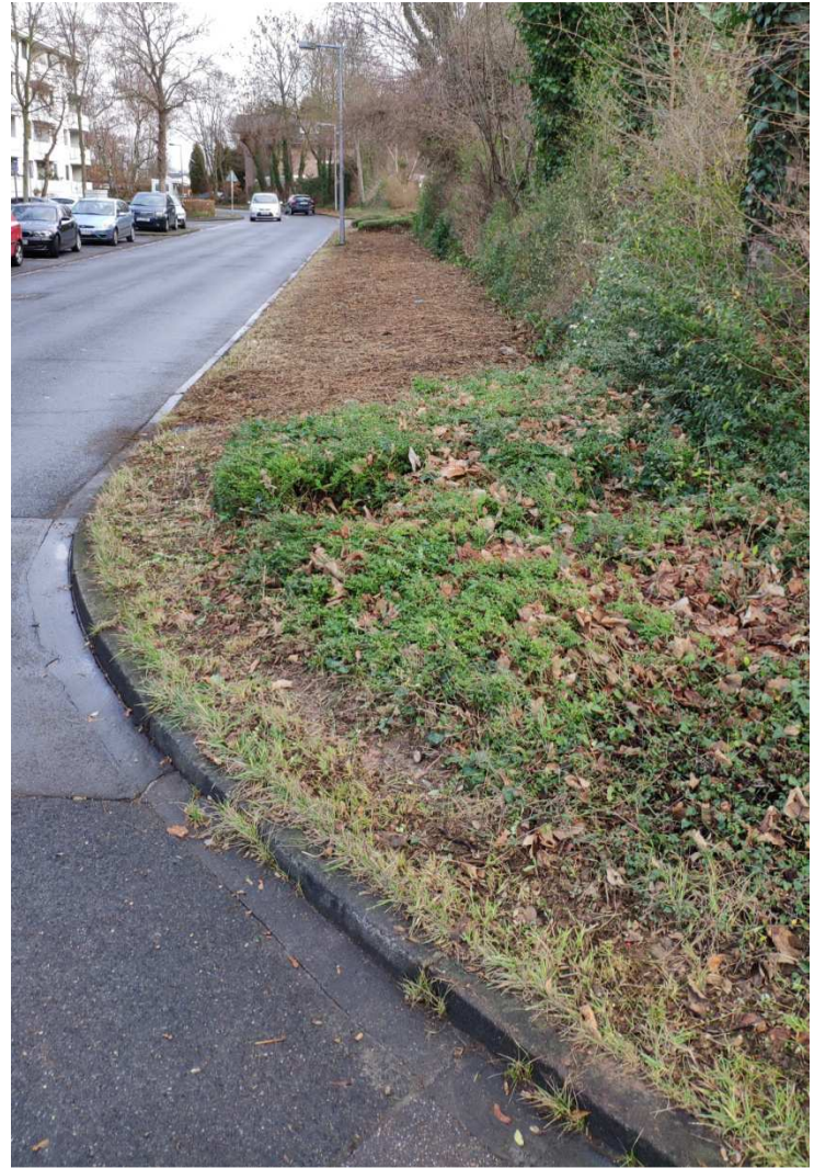
Nord-Ansicht "Abschnitt 1" Richtung Buchenpfad