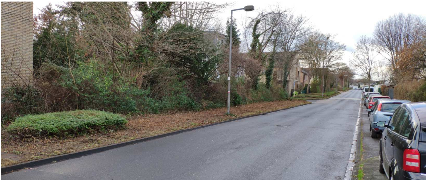
Seitenansicht: Kein Baum der gefällt werden müsste und nur eine Laterne auf dem Streifen "Abschnitt 1"