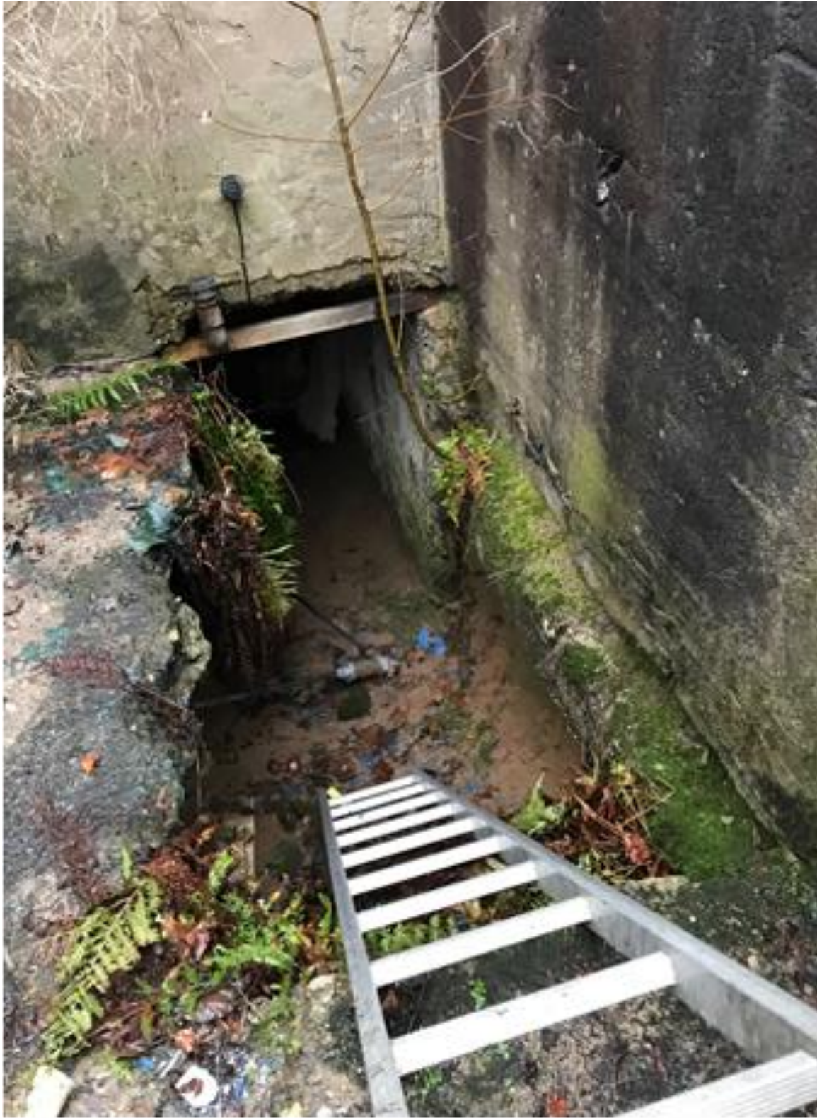
(Abgang zum Heizungskeller)