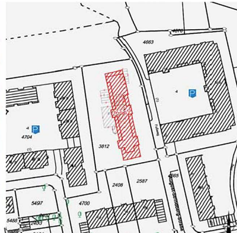
Geplantes Bauvorhaben (unmaßstäblich)