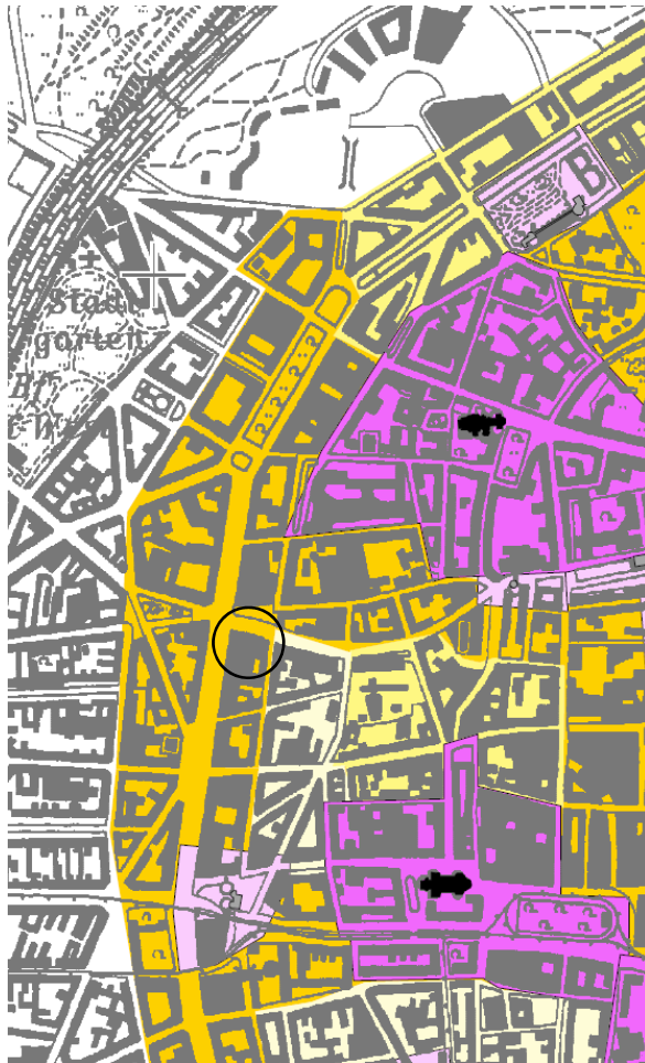
Höhenplan - Plan 9

Höhenkonzept für die linksrheinische Innenstadt – Auszüge Ratsbeschluss aus 2007 (ohne Maßstab)