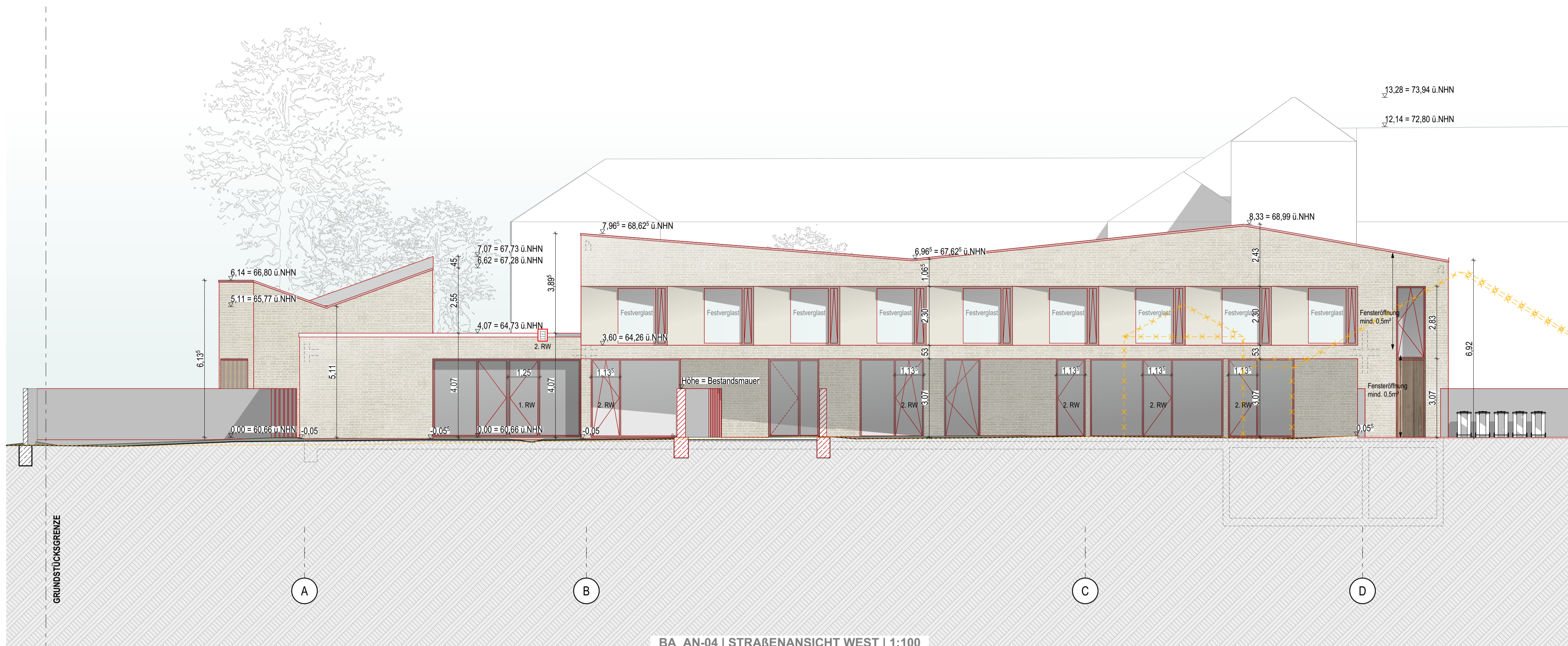
BA_AN-04 | STRAßENANSICHT WEST | 1:100