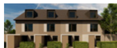
Ansicht Reihenhäuser und Doppelhäuser