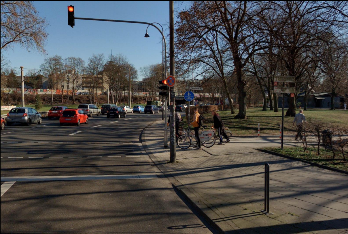
Abbildung 2: Konfliktstelle Fußgängerampel

Im Bereich der Fußgängerampel (siehe Abbildung 2) soll der Radverkehr gemeinsam mit dem Autoverkehr zugunsten des querenden Fußverkehrs angehalten werden. So sollen die häufigen Konflikte zwischen Radfahrenden und zu Fuß Gehenden im Bereich der Aufstellfläche entschärft werden.