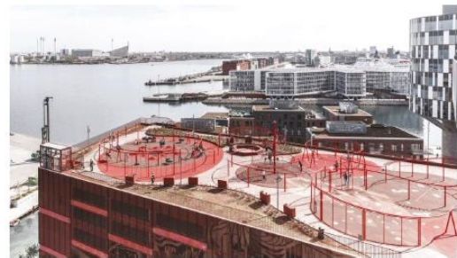
Parkhaus mit Dachnutzung, Kopenhagen /Jaja