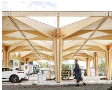
Ladestation als Holzkonstruktion, Fredericia /Cobe