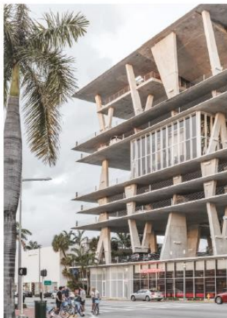
Parkhaus mit EG-Nutzung, Miami /Herzog de Meuron