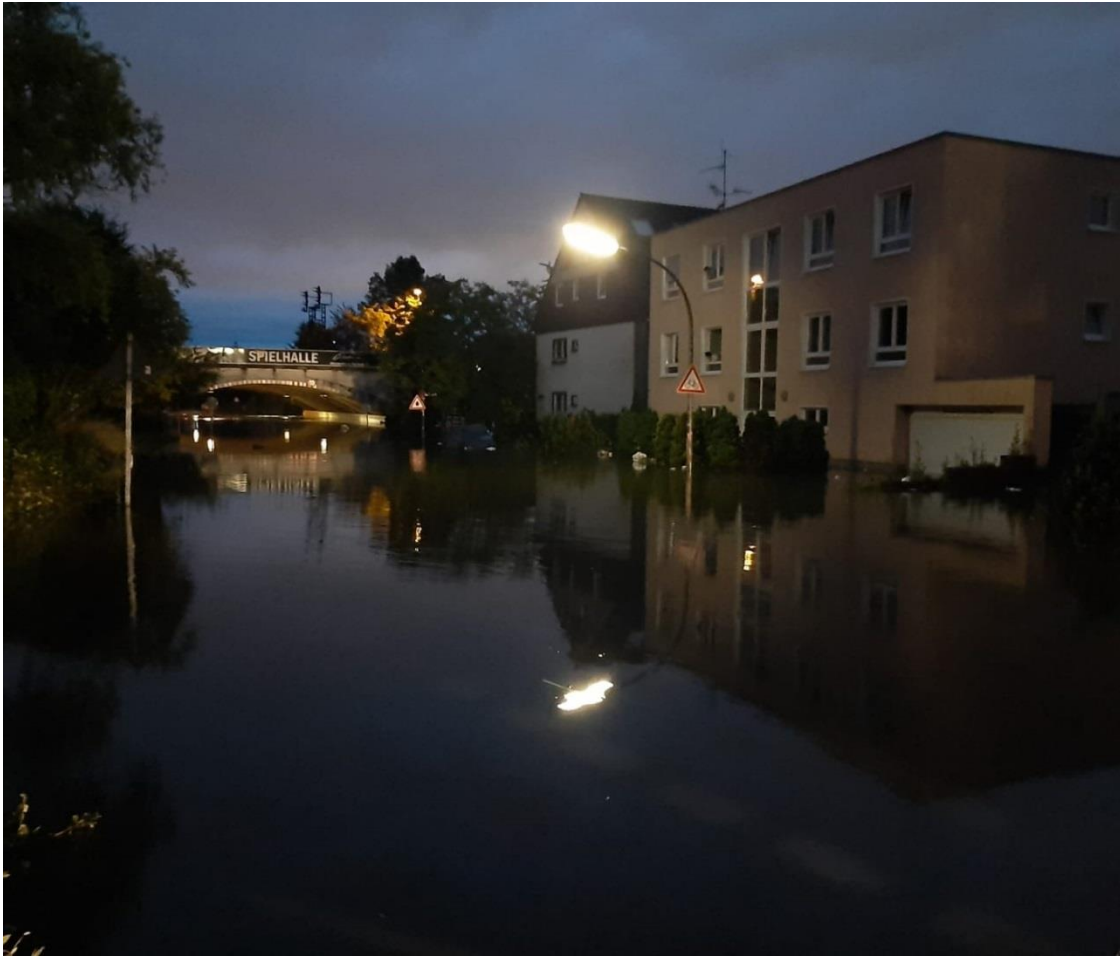
Blick vom Adlerweg/Vogelsanger Str in Richtung Unterführung.