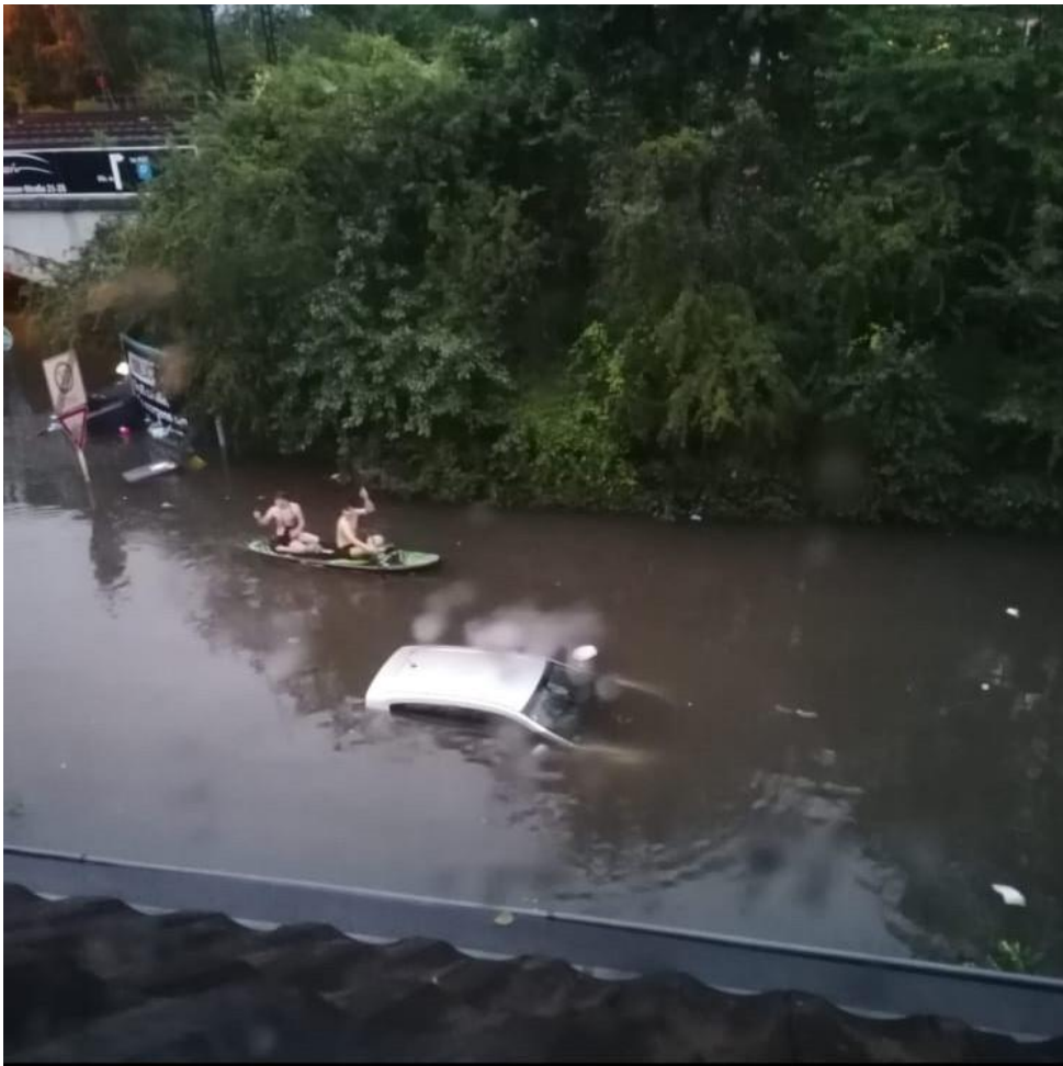
Anfang Gelbspötterweg direkt hinter der Unterführung links.