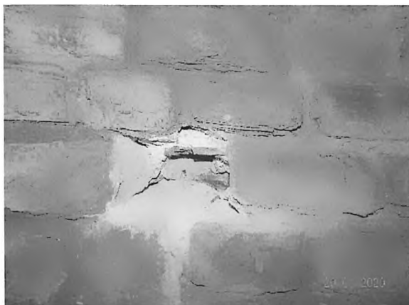
Abb. 2: „Sondage 1“ ungestörter Wandbereich

Im ungestörten Wandteil konnte kein Abriss zwischen Schale und Kern festgestellt werden (Abb. 2).