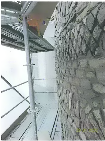
Abb. 1: ca. 16 cm Ausbauchung der Außenfläche

Während der Bestandsaufnahme durch [REDACTED] wurden auffällige Rissbildungen und eine Ausbauchung in einem Teilbereich der Turmflächen festgestellt (Abb. 1).