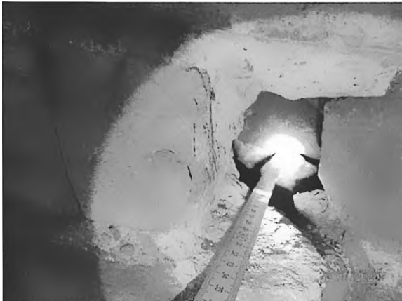
Abb. 5: „Sondage 3“ Beulenbereich äußere Schale d \approx 20 cm, Hohlraum d \approx 16 cm

Die dritte Sondage wurde unmittelbar in der „Beule“ hergestellt. Auch hier wurde nur ein Stein entnommen.