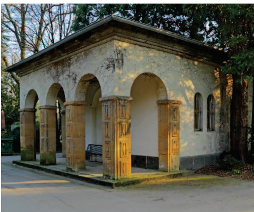
Ehemalige Trauerhalle Melatenfriedhof, Köln

Unseren Entwürfen liegt jeweils der Gedanke zugrunde, dass wir ein intensives Raumerlebnis schaffen möchten. Bei der Frage, welcher grundlegenden Konzeptidee wir dabei folgen wollen, sprachen wir im Team darüber, an welchen Orten wir bisher die Atmosphäre erlebt haben, die wir uns für die zu gestaltenden Kolumbarien wünschen. Wiederholt wurden sakrale Räume genannt, die wir als Touristen, Gläubige oder Trauernde besucht haben. So entstand die Konzeptidee: Unsere Entwürfe basieren auf einer assoziativen Interpretation sakraler Räume. Dabei reagiert der jeweilige Entwurf auf die spezifische (Raum-)Situation auf dem Melatenfriedhof und dem Friedhof Weiß.