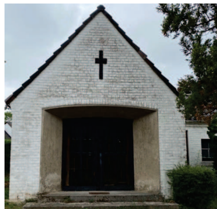
Ehemalige Trauerhalle Friedhof Weiß, Köln