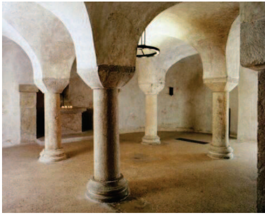
Simpert-Krypta , Mariendom, Augsburg

Der um ein Vielfaches kleinere Raum der ehemaligen Trauerhalle auf dem Friedhof Weiß, hat uns zu einer ganz anderen sakral-architektonischen Assoziation verleitet, als die ehemalige Trauerhalle auf dem Melatenfriedhof. Die intime Raumsituation erinnert an eine Krypta. Anders als eine solche „Unterkirche“ ist das Kolumbarium auf dem Friedhof Weiß oberirdisch, jedoch unterstützt die Deckengestaltung mit den charakteristischen Schrägen die Assoziation mit einem Gewölbe. Die Fensterflächen der Westseite schließen wir durch eine vollflächige Urnenwand.