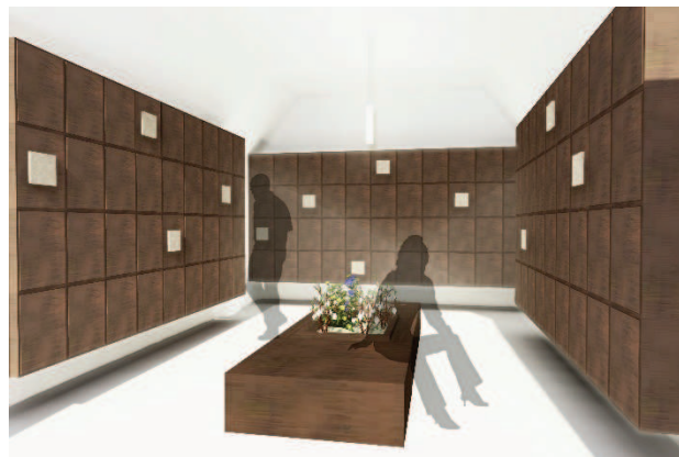
Entwurf 03, Friedhof Weiß