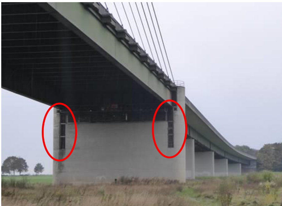
Bild 3: Ausführung einer abnehmbaren Öffnung am Ankerpfeiler am Beispiel der Rheinbrücke Rees